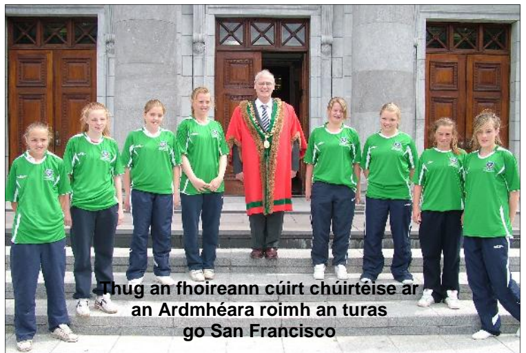
Thug an fhoireann cúirt chúirtéise ar an Ardmhéara roimh an turas go San Francisco

D'eisigh Comhairle Cathrach Chorcaí, trína hOifigeach Forbartha Spóirt, cuiridh chuig eagraíochtaí éagsúla spóirt, agus sa deireadh thiar socraíodh go rachadh foireann cailíní scoile ó Shraith Sacair na mBan agus na gCailíní Scoile Chorcaí go San Francisco le páirt a ghlacadh sna Cluichí, a bhí ann ón 10 go 15 Iúil, 2008.